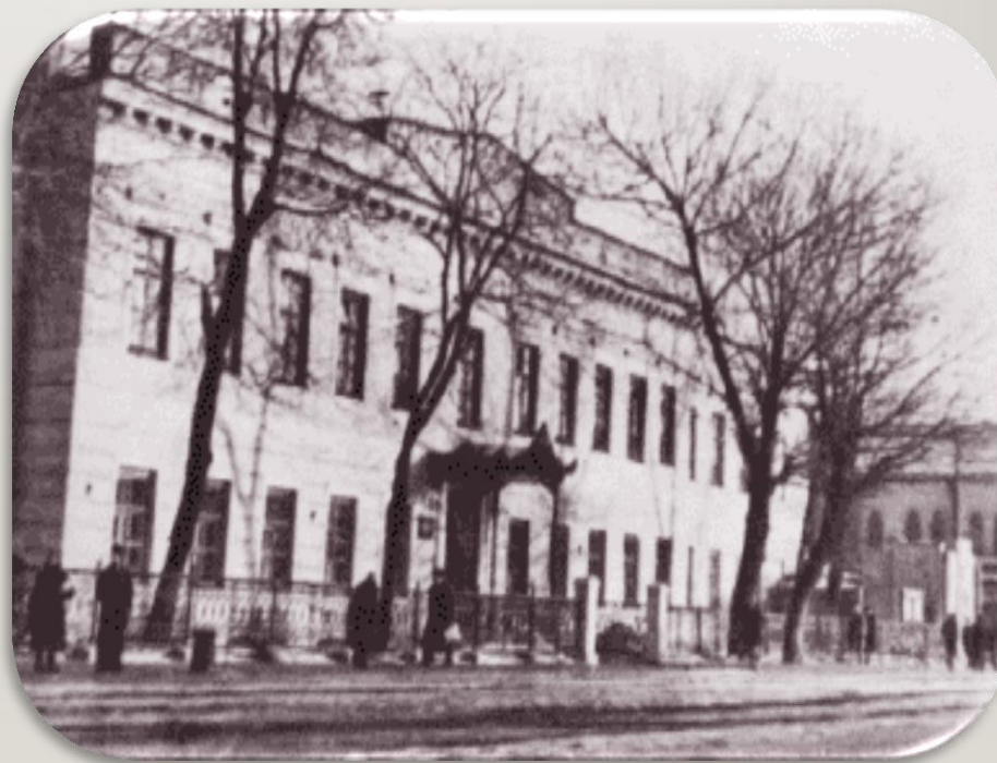
Орловская гимназия, в которой учился Л. Н. Андреев