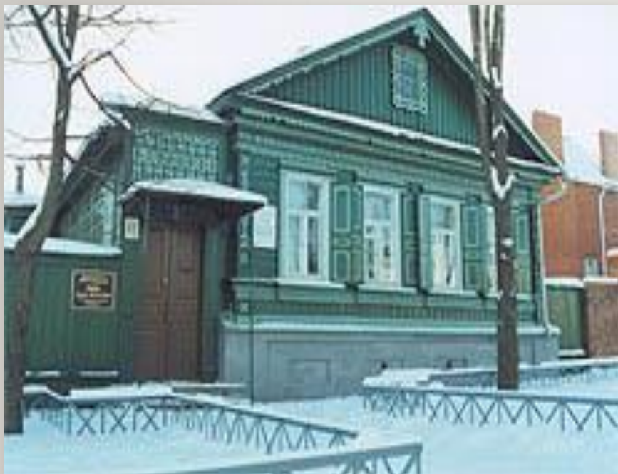
Дом – музей в городе Орле